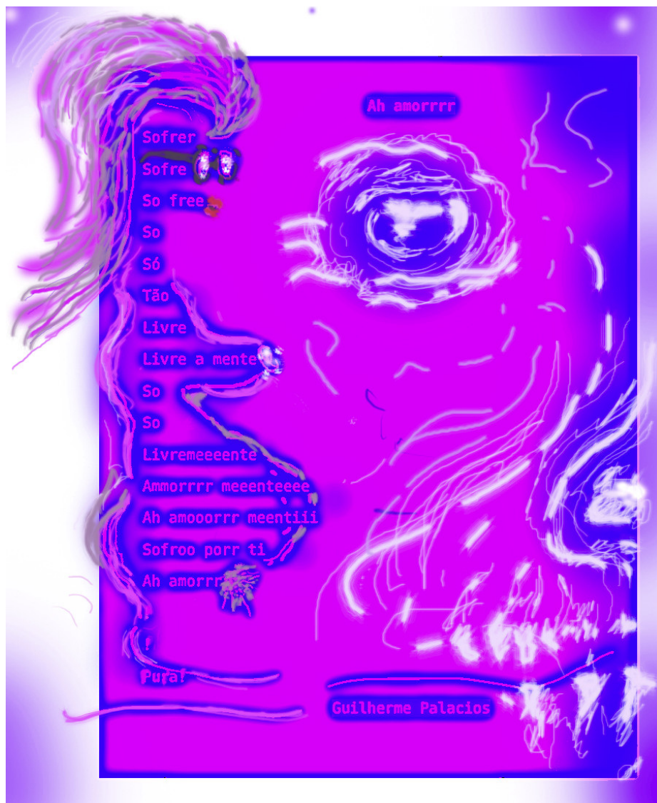
Memórias de um tatuador, poeta e professor.